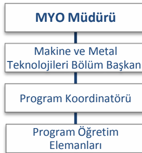
Şekil 1. ÜKK Programı Organizasyon Şeması